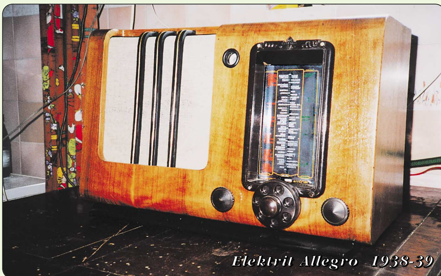
Elektrit Allegro 1938-39

Bardzo się cieszę, że w Waszym magazynie znalazłem sporo dobrych rad i informacji.